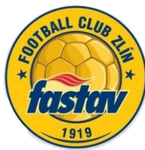
FC FASTAV ZLÍN