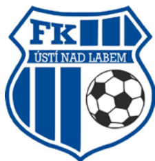
FK ÚSTÍ NAD LABEM