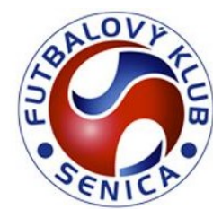
FK SENICA (SVK)