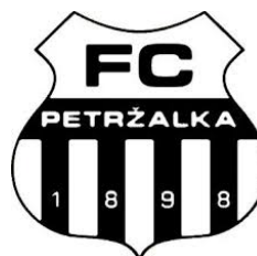
FC PETRŽALKA (SVK)