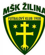
MŠK ŽILINA (SVK)