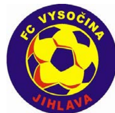
FC VYSOČINA JIHLAVA