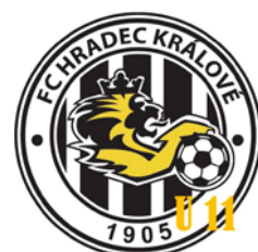
FC HRADEC KRÁLOVÉ U11