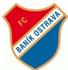
FC BANÍK OSTRAVA