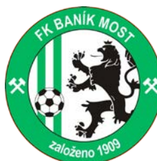
FK BANÍK MOST