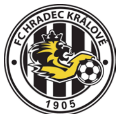
FC HRADEC KRÁLOVÉ