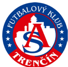
AS TRENČÍN (SVK)