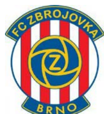
FC ZBROJOVKA BRNO