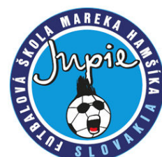
JUPIE BANSKÁ BYSTRICA (SVK)