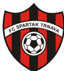
FC SPARTAK TRNAVA (SVK)