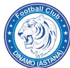
DINAMO ASTANA (KZ)